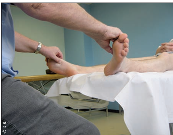
▲ Fig. 4 - Application bilatérale et symétrique