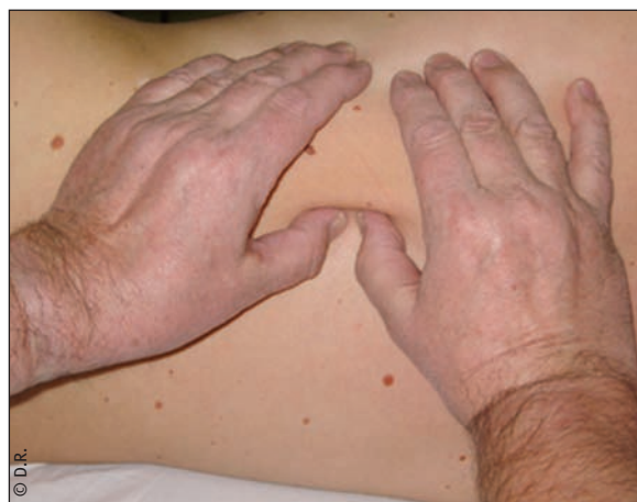
▲ Fig. 5 - Le masser-rouler

Selon l'objectif fixé par le thérapeute, et selon la sensibilité neurovégétative du patient, les séances (1 à 15) dureront de 15 à 30 minutes.