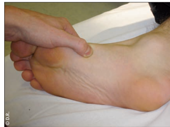
▲ Fig. 1 - Recherche de points douloureux

Pour comprendre les possibilités thérapeutiques réflexes au niveau du pied, il faut tenir compte de l'organisation métamérique du corps humain pour tout ce qui est sous-ombilical, et des centres supra-segmentaires, dont la