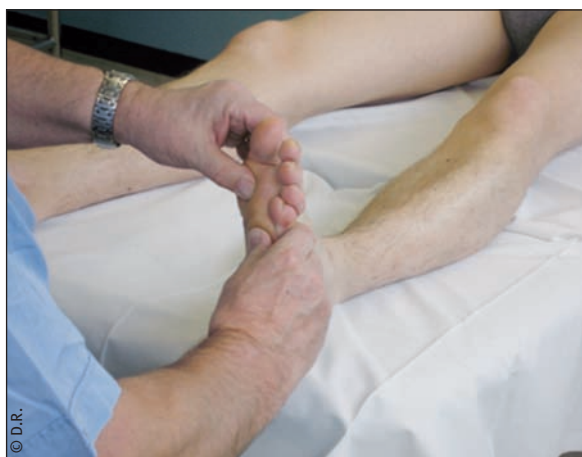
▲ Fig. 3 - Exploration avec le pouce

formation réticulaire du tronc cérébral en particulier, lieu de convergence de toutes les voies sensorielles [2, 3].