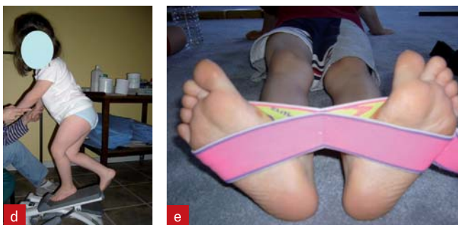
Figure 4. Rééducation active après l'acquisition de la marche.