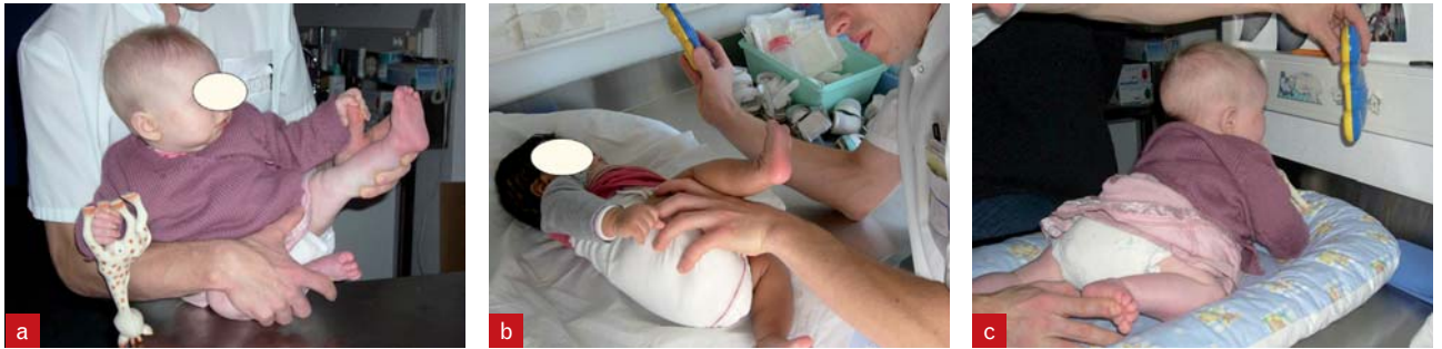
Figure 2. Rééducation active avant l'acquisition de la marche (déséquilibres latéraux, retournement, pseudo-ramper).