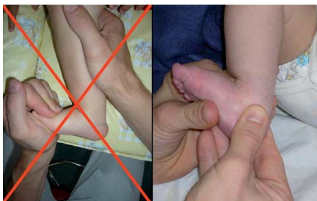
Figure 5. Lors des mobilisations passives, le pied doit être placé en dérotation maximale du BCP. L'index contrôle la bonne réintégration du talus. Aucune manœuvre de poussée ne doit se situer sous la palette métatarsienne ou sous les orteils car le risque de « casser » le pied dans la médio-tarsienne est considérable. Lors du travail de la flexion dorsale, la main la plus active est celle qui tracte le calcanéum vers le bas.

Nous utilisons aussi les exercices de la rééducation « neuro-motrice » [3] qui entraînent une action sur les muscles éverseurs : déséquilibres latéraux, suspensions latérales, retournements, pseudo-rampier ( figure 2 ).