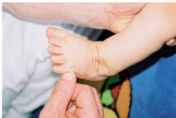
Figure 1. Stimulation musculaire des muscles fibulaires.

le bout des doigts (ongle) ou à l'aide d'une brosse à dent, sur le bord latéral du segment jambier et du pied [2]. Le pied est préalablement placé en position corrigée afin de rapprocher les insertions des fibulaires et favoriser les mouvements d'éversion. Les stimulations sont réalisées autant de fois que les réponses motrices sont efficaces. En cas d'absence de réponse ou de déclenchement d'un mouvement varisant, les stimulations doivent être interrompues en raison du risque de renforcement des muscles opposés à la correction. Ces stimulations peuvent être enseignées aux parents.