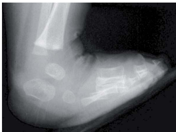
Figure 6. Pied convexe iatrogène. Noter la position ascensionnée du calcanéum qui est resté en équin. La flexion dorsale se produit au niveau du médio-pied.

Les kinésithérapeutes sont alertés sur les risques liés aux mobilisations passives. Toute mobilisation du pied doit suivre l'ordre des manœuvres décrites par Ponseti. Tout mouvement de flexion dorsale doit être précédé d'une dérotation maximum du BCP ( figure 5 ). Sans cette