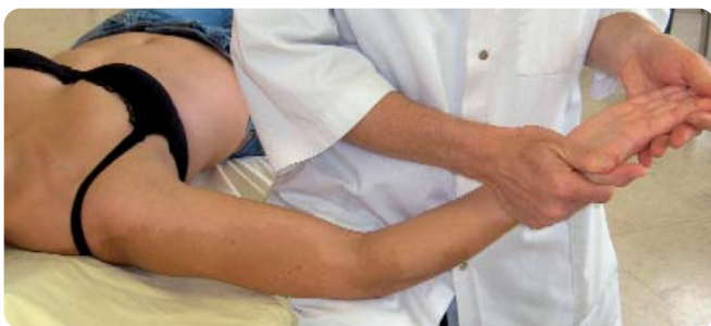
Figure 8. Mise en tension nerveuse progressive par une combinaison d'abduction d'épaule, d'extension du coude et d'extension des doigts.

(figure 6); puis la mobilisation nerveuse est distale par extension des doigts, le coude étant maintenu fléchi (figure 7); enfin la mise en tension nerveuse est progressive par une combinaison d'abduction d'épaule, d'extension du coude et d'extension des doigts (figure 8). Après réévaluation des signes cliniques subjectifs, l'étape suivante est de répéter les techniques mobilisatrices de la main décrites précédemment, le coude positionné en extension pour se rapprocher peu à peu des attitudes déclenchant les symptômes au début de la prise en charge.