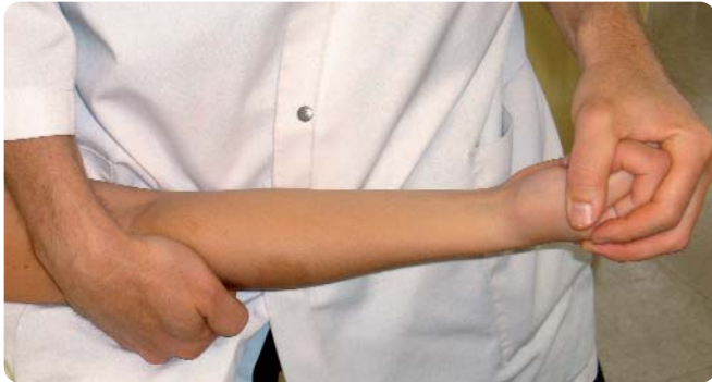
Figure 6. Mobilisation nerveuse proximale par extension du coude. Le pouce et les doigts sont maintenus fléchis.

La récupération de la mobilité des nerfs s'opère par étapes pour ne pas irriter le nerf médian. Nous recherchons un glissement du nerf par rapport aux structures anatomiques environnantes tendineuses et vasculaires et non par un étirement [3, 4]. À cet effet, les contraintes nerveuses sont diminuées par un positionnement adéquat des articulations adjacentes [5]. La mobilisation nerveuse proximale débute par une extension du coude, le pouce et les doigts sont maintenus fléchis