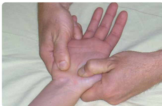
Figure 5. Étirement indirect du ligament en utilisant les muscles intrinsèques du pouce et du 5 e doigt.