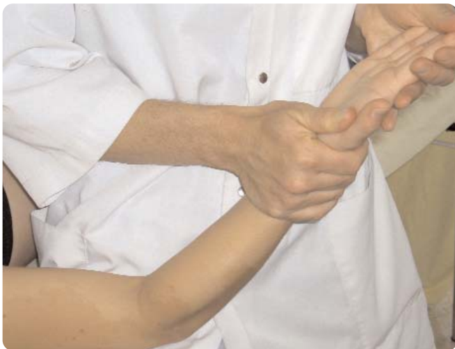
Figure 7. Mobilisation nerveuse distale par extension des doigts. Le coude est maintenu fléchi.