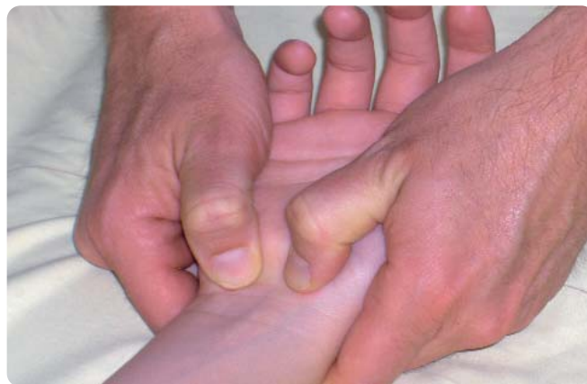
Figure 3. Étirement du ligament antérieur du carpe par ses insertions osseuses proximales.

importante en élongation chez les femmes. Le résultat d'élargissement du tunnel carpien est résiduel si les techniques manuelles du thérapeute sont associées à des postures ou des auto-étirements maintenus d'une intensité de l'ordre de 10 Newton.