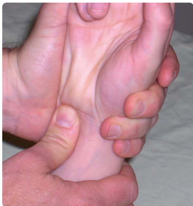
Figure 2. Manœuvre de creusement de l'arche carpienne par contre appui antérieur au dessus du pisiforme.