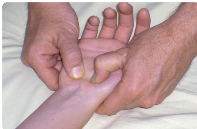
Figure 4. Étirement du ligament antérieur du carpe par ses insertions osseuses distales en maintenant toujours le poignet en position neutre.